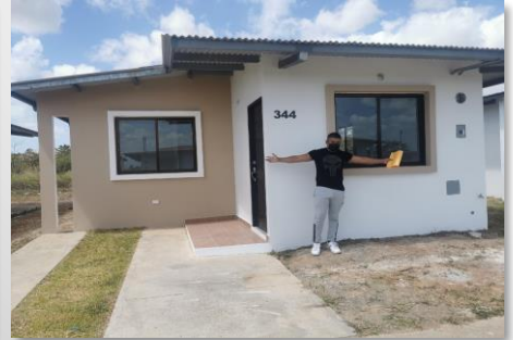
1era casa entregada Febrero 2021