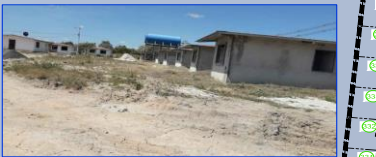
Vista 3: De Calle Eilen Coparropa con 5 unidades en fase de acabados, al fondo tanque e inicio de Calle Alonso Edward.