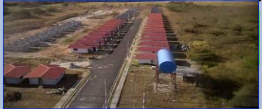
Vista 1: De Calle Alonso Edward desde acceso principal, se observan casas en acabados, con techo instalado y al final resto de viviendas con paredes levantadas.