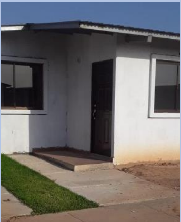
Primeras unidades ya se encuentran finalizadas y entregadas, cuentan con permiso de ocupación. 345@342 y 299@295