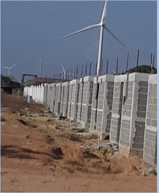
Vista de unidades 323@330 hacia tanque de reserva de agua (bloqueo hasta viga sísmica).