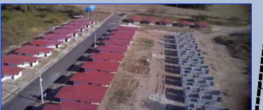
Vista 2: Aérea de Calle Alonso Edward (Casas entregadas y avanzadas en acabados, Calle Irving Saladino (con casas en paredes levantadas) y al fondo Calle Eilen Coparropa (con unidades con Techo y acabados iniciales).