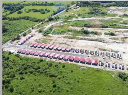
Foto aérea agosto 2019