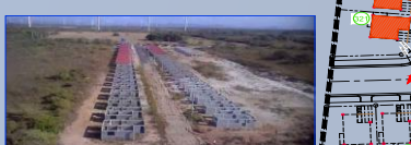
Vista 5: Final de Calle Alonso Edward, se observa también unidades levantadas en paredes de Calle Irving Saladino

PROYECTO: QUINTAS DE PENONOMÉ AVANCE DE OBRA DE FASE 1 AVANCE DE OBRA: 05 DE MARZO DE 2022.