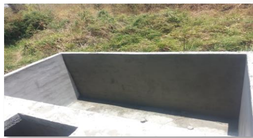
Planta de tratamiento