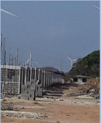
Vista de unidades 280@289 hacia el acceso del proyecto, (bloqueo hasta viga sísmica)