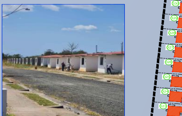
Vista 4: De Calle Alonso Edward, entre unidades en acabados y Unidades con paredes levantadas.